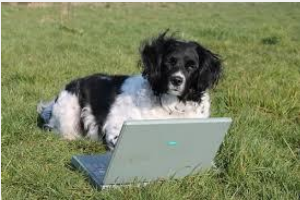
V.U Nimrodsvrienden vzw