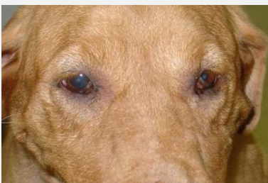
Een hond met het syndroom van Horner op het rechter oog

De symptomen komen door een beschadiging aan het autonome zenuwstelsel . Het autonome zenuwstelsel wordt onderverdeeld in een orthosympatisch en een parasympatisch deel.