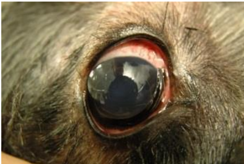
Een tibetaanse terrier met een luxatie van de lens naar de voorste oogkamer

Vooreerst zou de lens iets bolter zijn. Daarom zou de onderzoeken de rand van de lens te zien bij oogcontrole van een verwijde pupil. Momenteel wordt onderzocht of het zien van de rand van de lens bij oogonderzoek een waarde zou hebben in verband met het kunnen voorspellen van een latere lensluxatie.